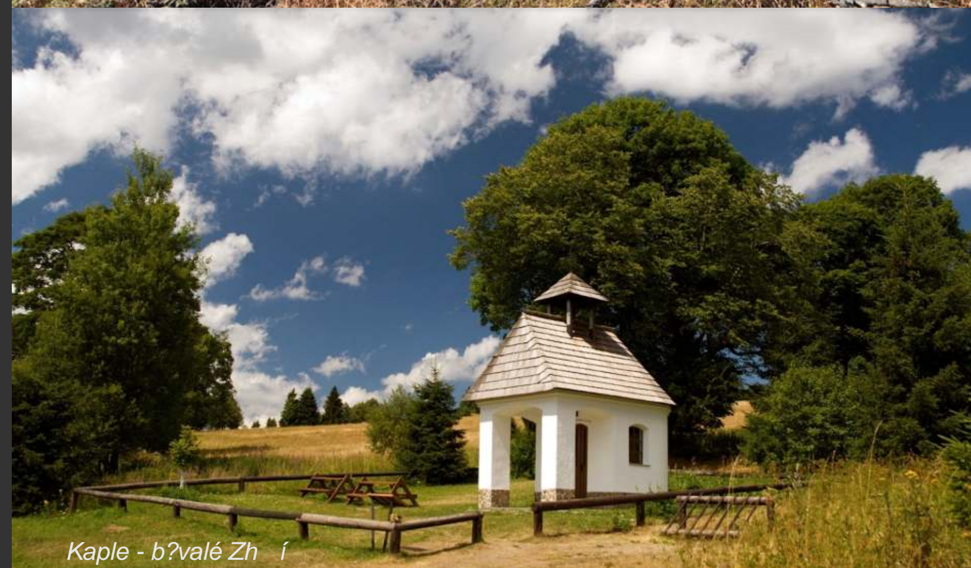
Kaple - bývalé Záhřbí