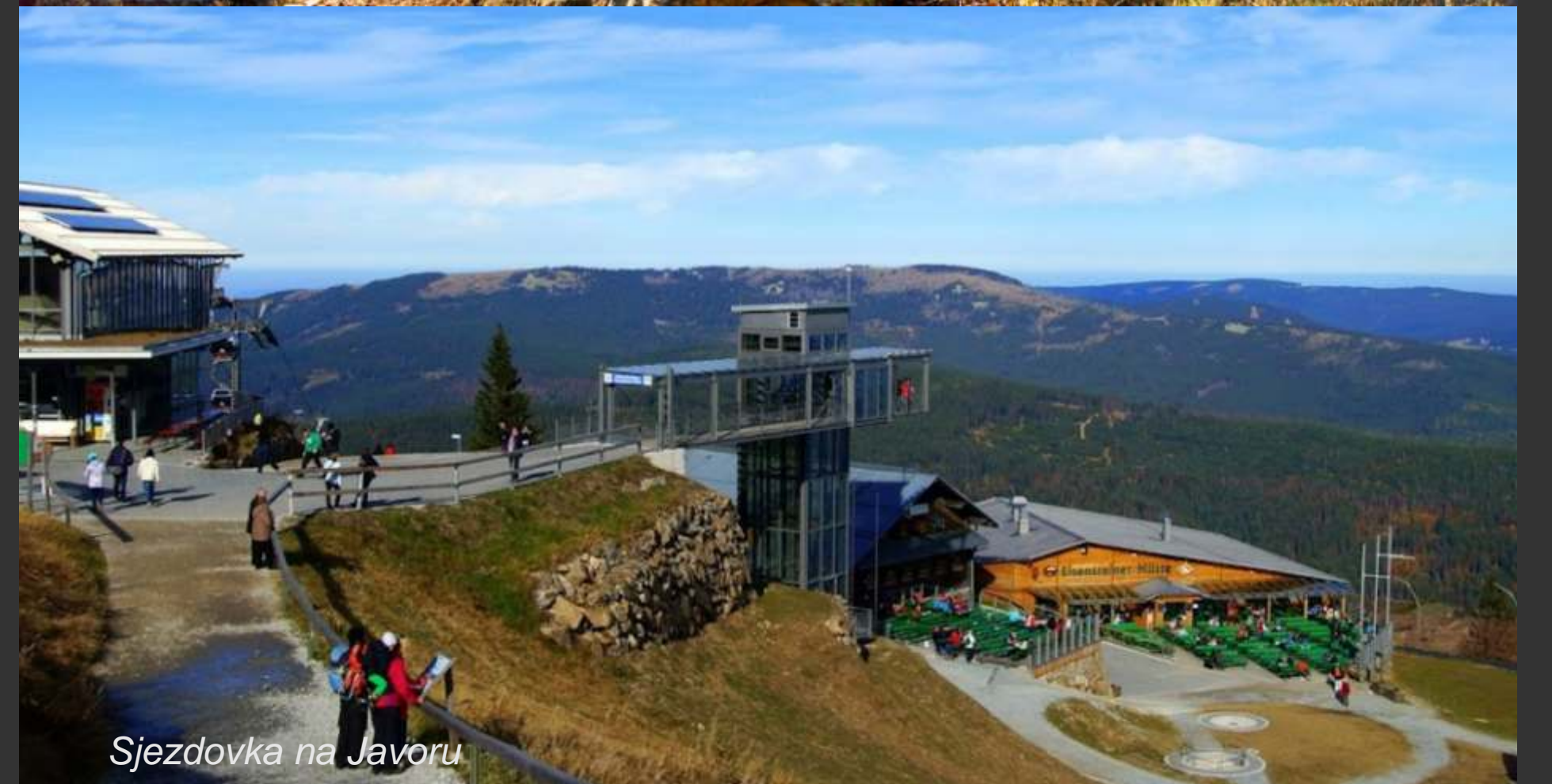
Sjezdovka na Javoru