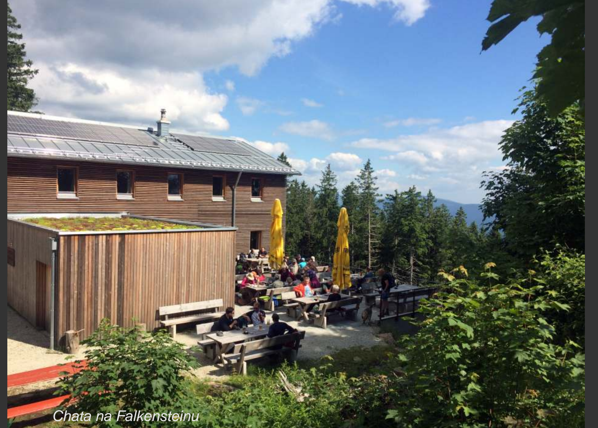
Chata na Falkensteinu