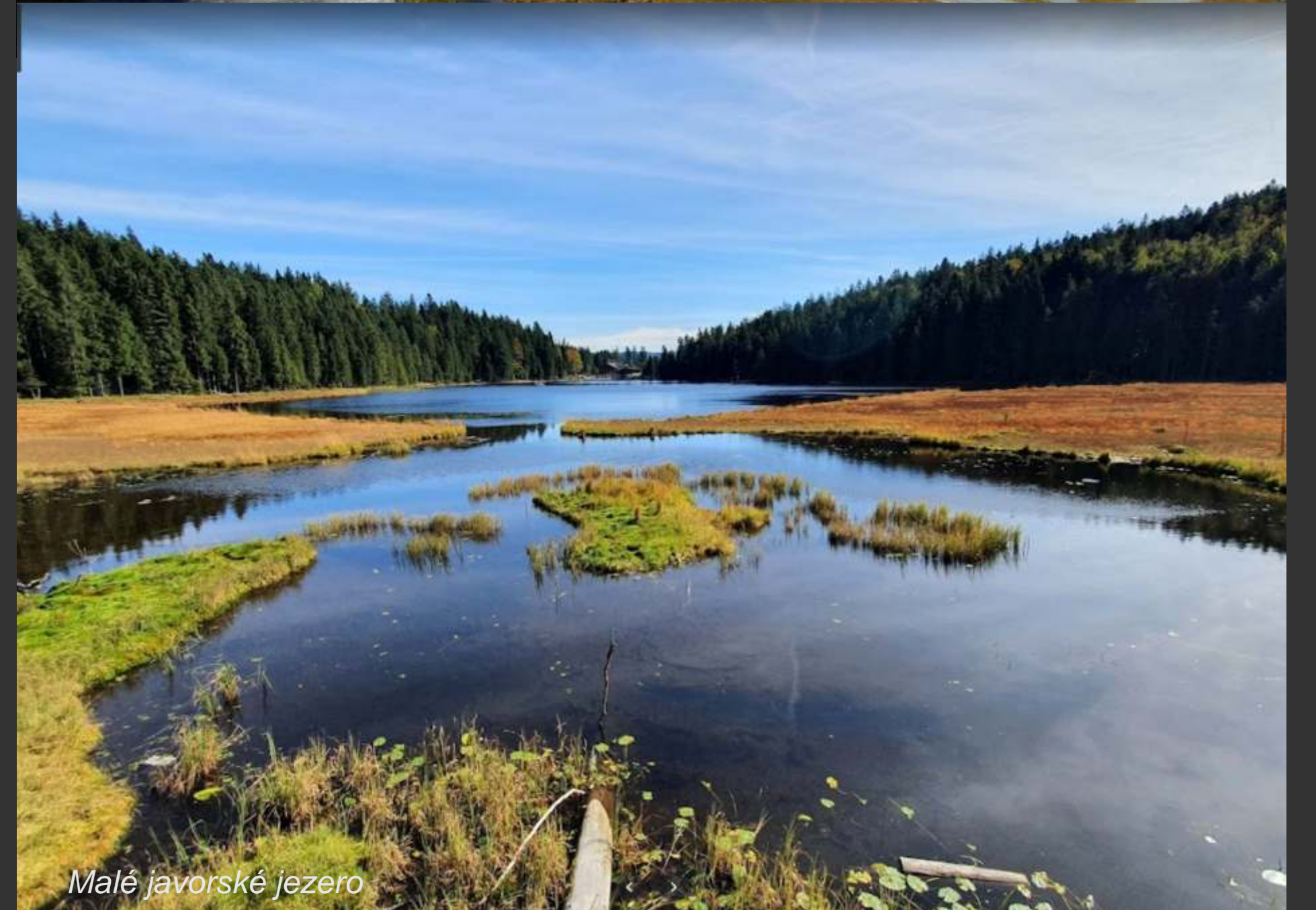
Malé javorské jezero