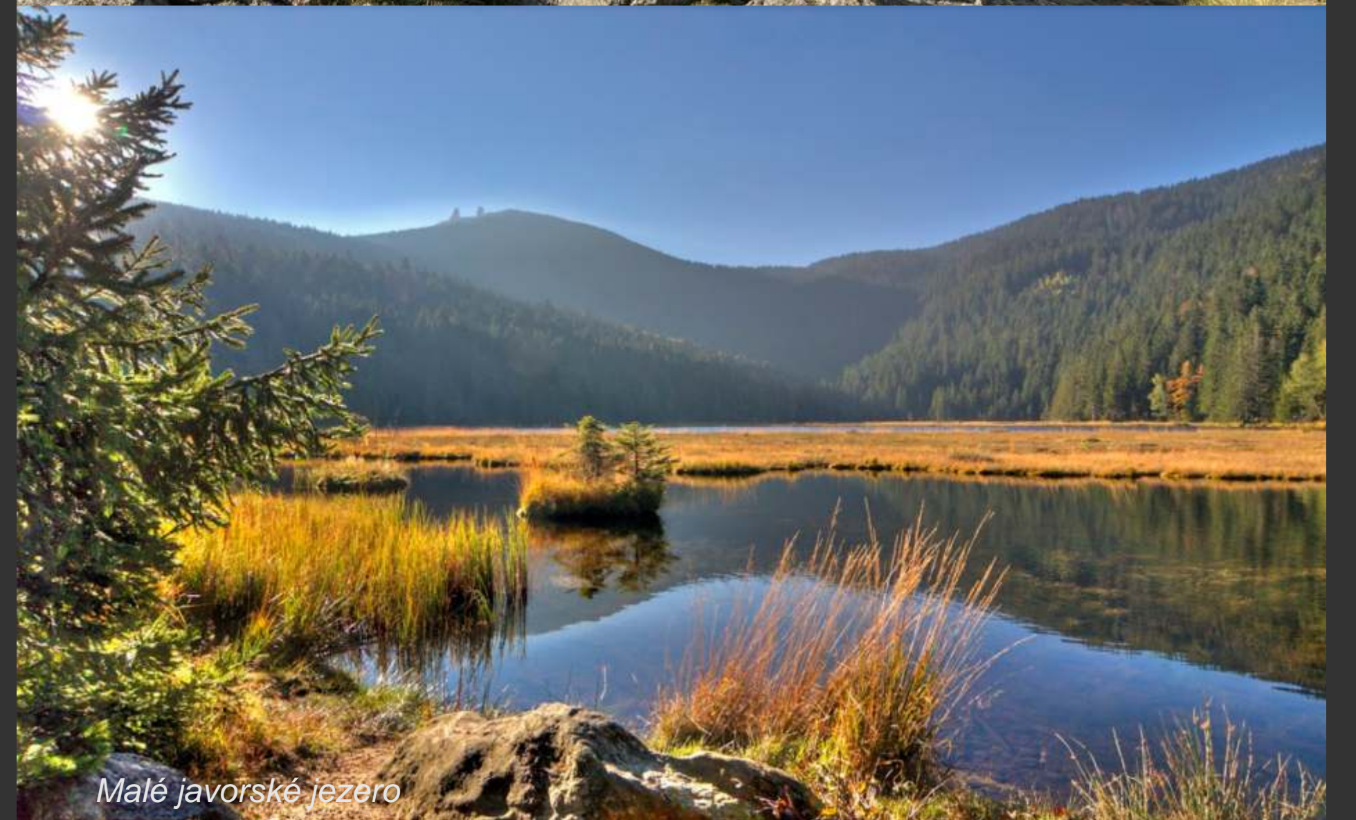
Malé javorské jezero