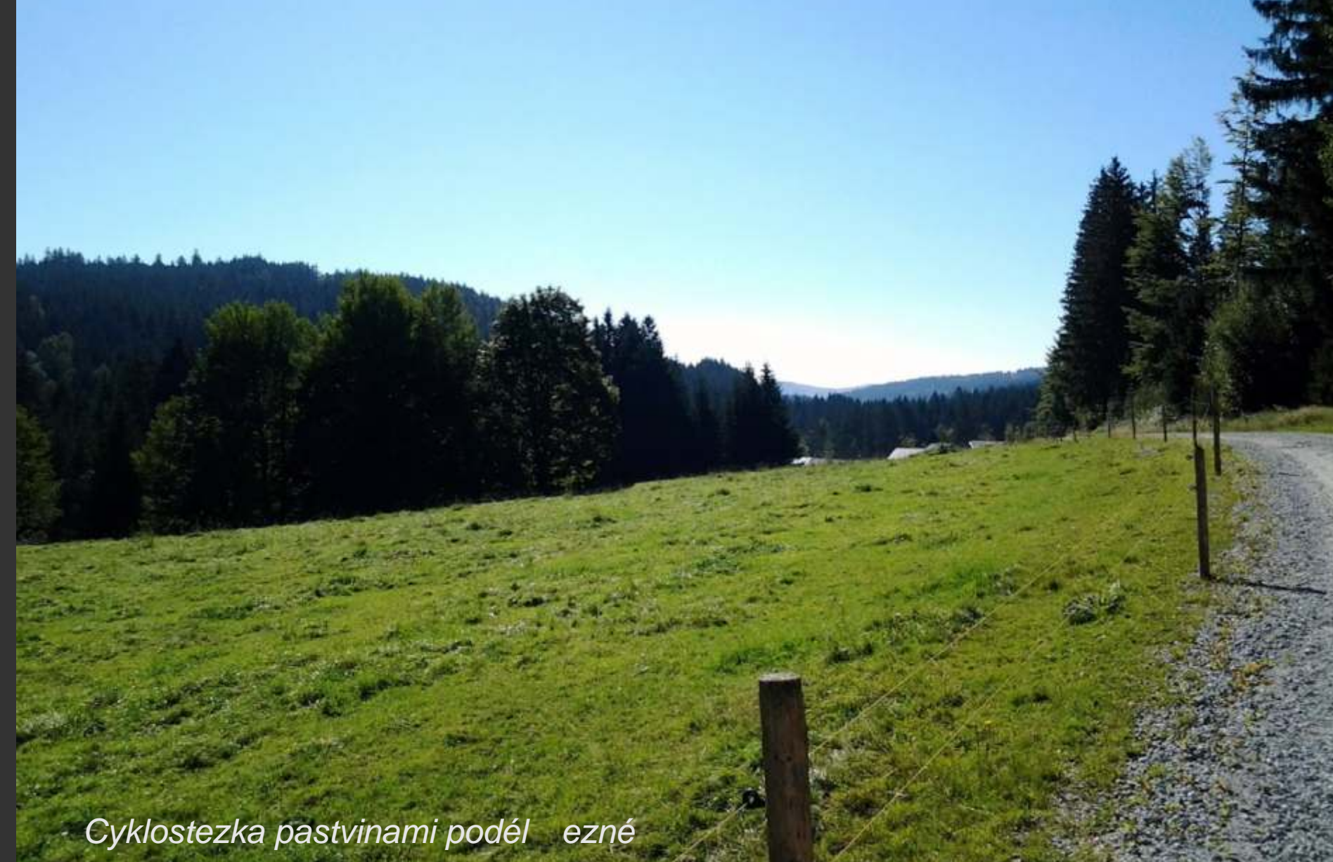
Cyklostezka pastvinami podél řeky

Trasa vede kolem kavárny Rozhlas, kde je možné ochutnat domácí výrobky i plzeňské. Po Železnou Rudu a Bavorkou Rudu po cyklostezce stále podél řeky. U bodu 4 je možné navštívit pizzerii Banderas a pokračovat do Lugwígsthalu, kde je velice atraktivní moderní centrum Šumavy s expozicí a výhledem na vrchol, vlk a praturu. To vše zdarma. Dále stále podél řeky do Zwiesslu. Kde je možné vylet ukončit, nebo pokračovat dále do Regenu. Odtud vlakem zpět na hranice a přesednout na další vlak na Špičák.