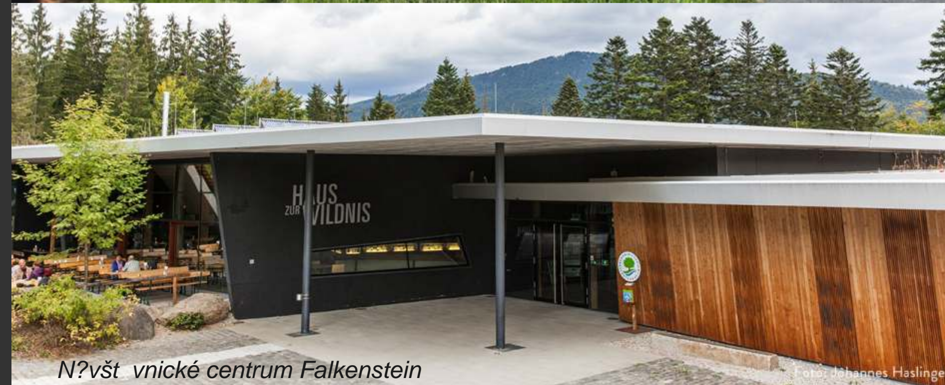
Navštívit návštěvní centrum Falkenstein