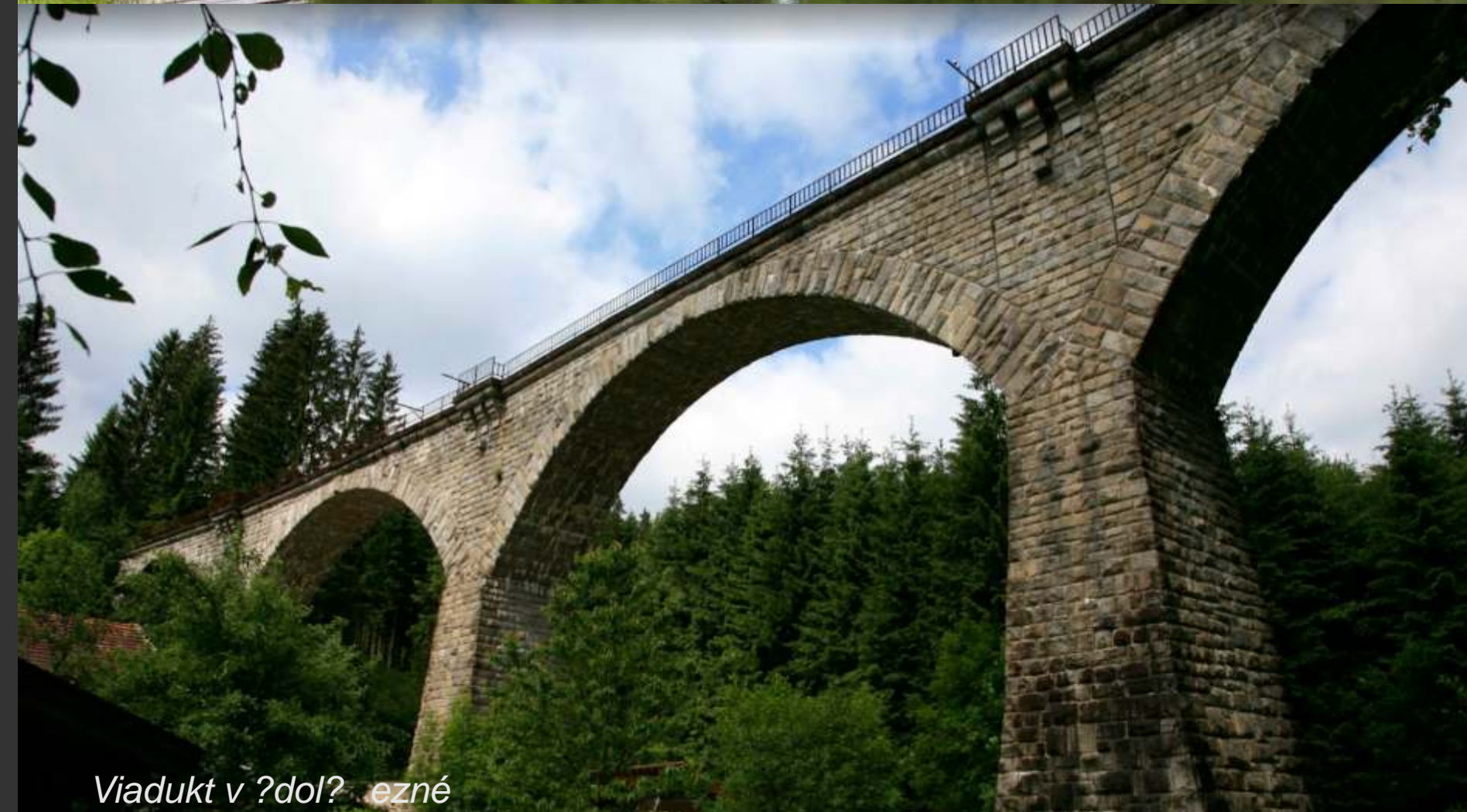
Viadukt v údolí řeky