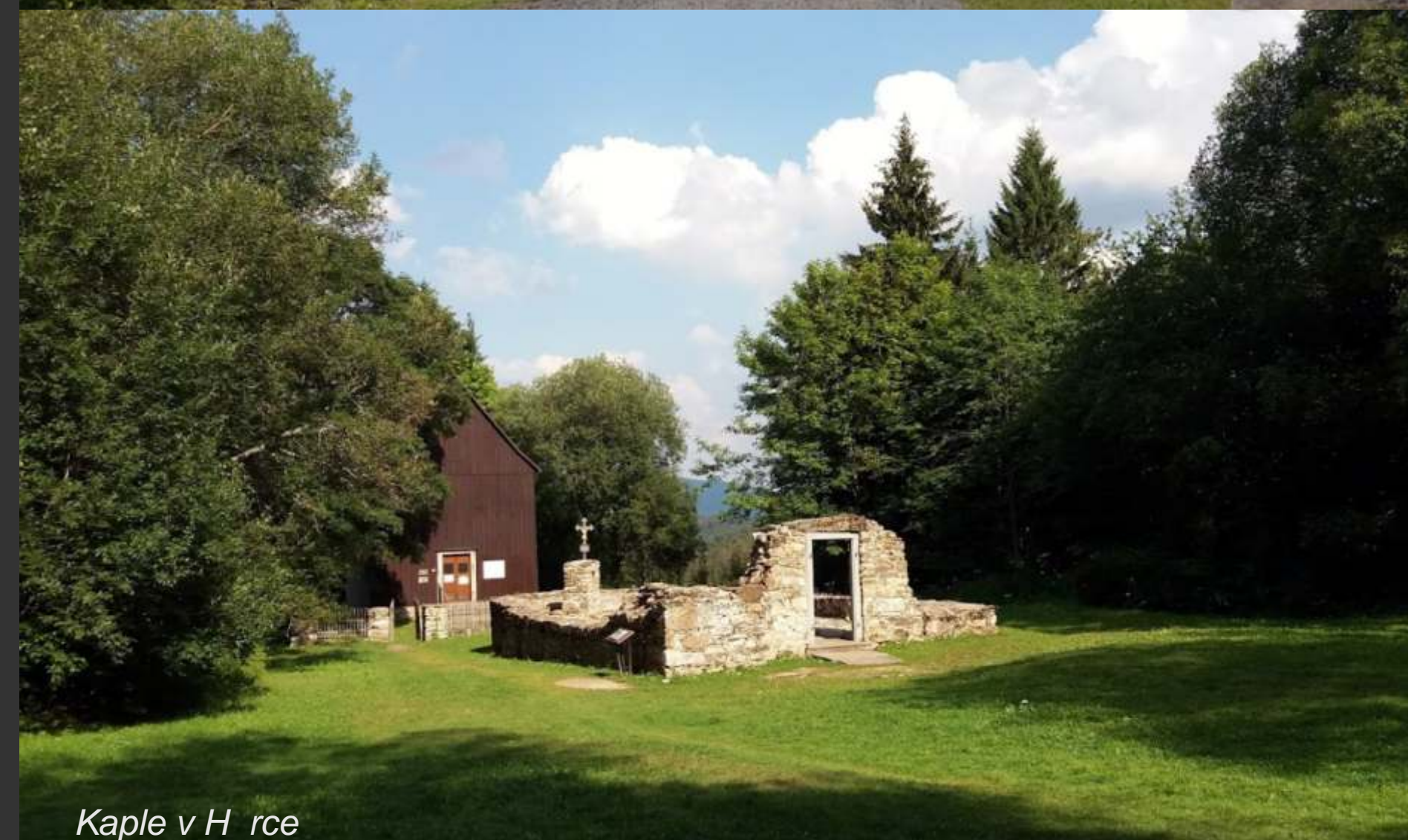
Kaple v Hůrce

Autobusem se dostaneme z Železné Rudy do startovního místa Nová Hůrka. Odtud stoupáme po modré k bývalé Hůrce. Pokračujeme po modré k jezeru Laka, vhodnému místu na vlastní svačinu na břehu. Dále po červené k Polomské věži pod Poloměm a odtud přes vrchol Polomu dolů ke Kneipovým lázním na Grádelském potoce u Železné Rudy. Z Železné Rudy po červené zpátky k hotelu.