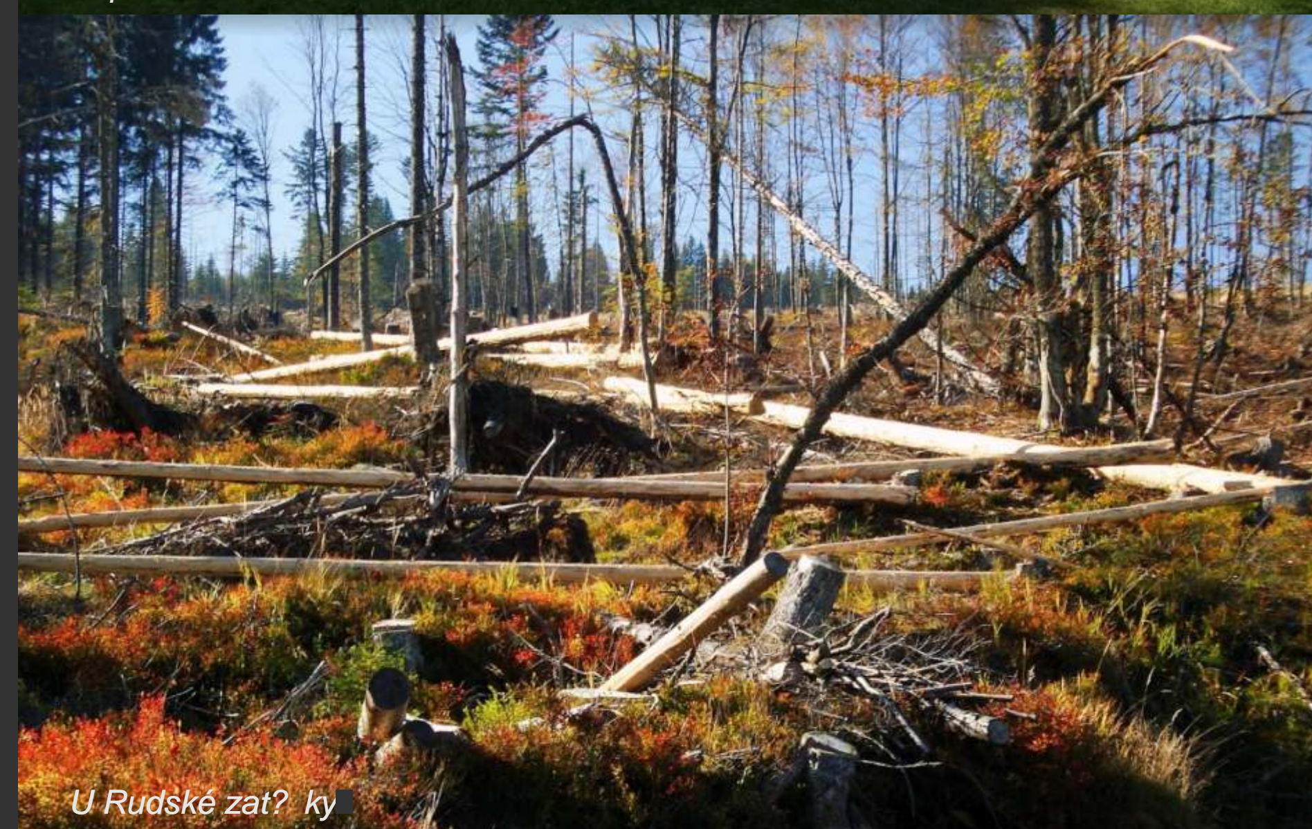
U Rudské zatoky