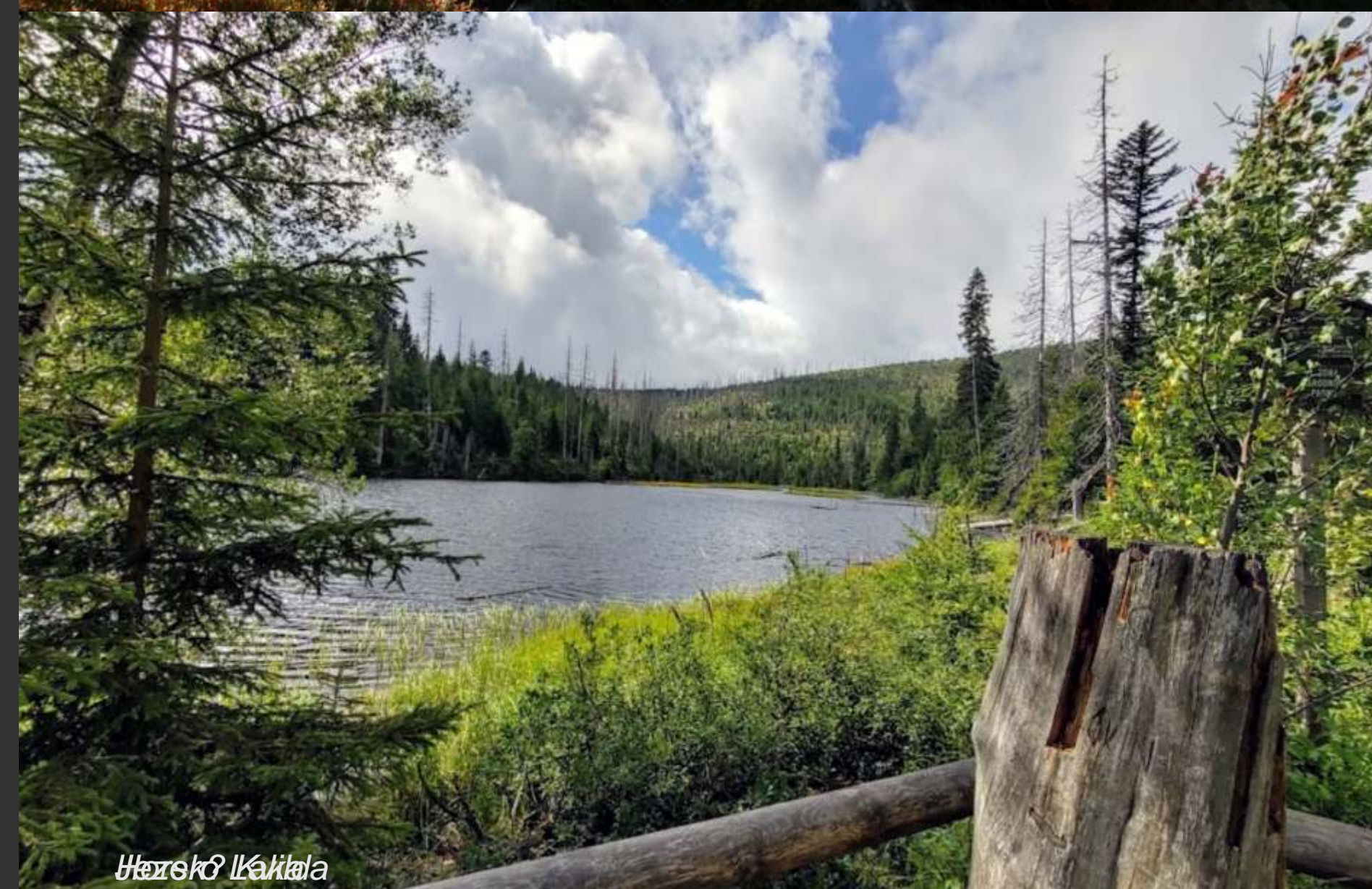
Horská lázeň v Laka