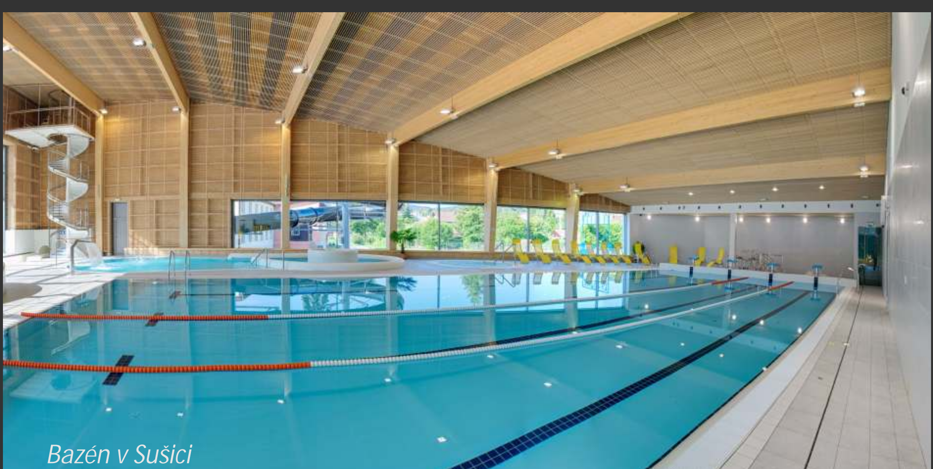
Bazén v Sušici

Sušicí protéká horská řeka Otava. Je zde možné podniknout celodenní výlet na kanoi nebo kajaku. Za normálního stavu vody trasa začíná v Sušici. V případě vyššího stavu vody po deštích, nebo v jarních měsících je možné začít na ústí řeky a doplnit do Sušice. Tato etapa je adrenalinovější a má více horský charakter.