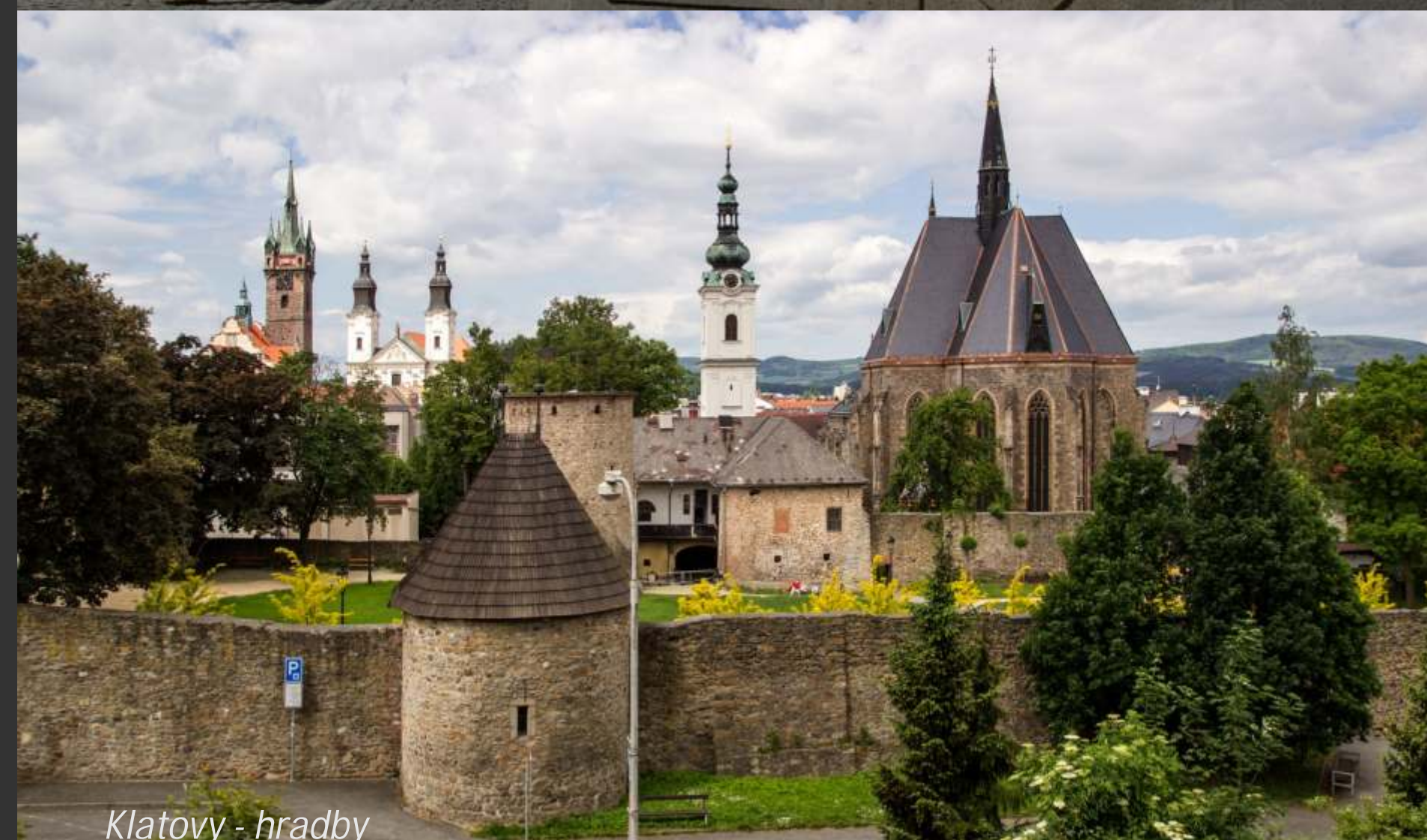
Klatovy - hrady