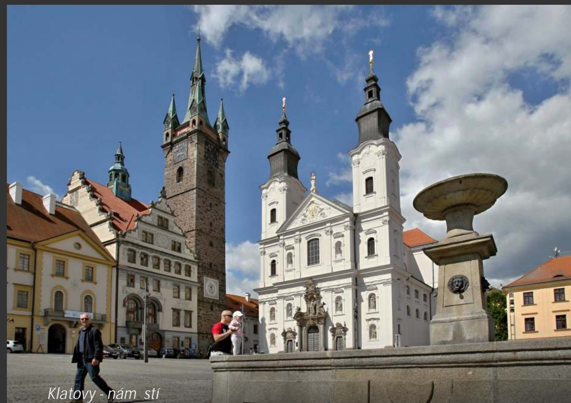
Klatovy - náměstí