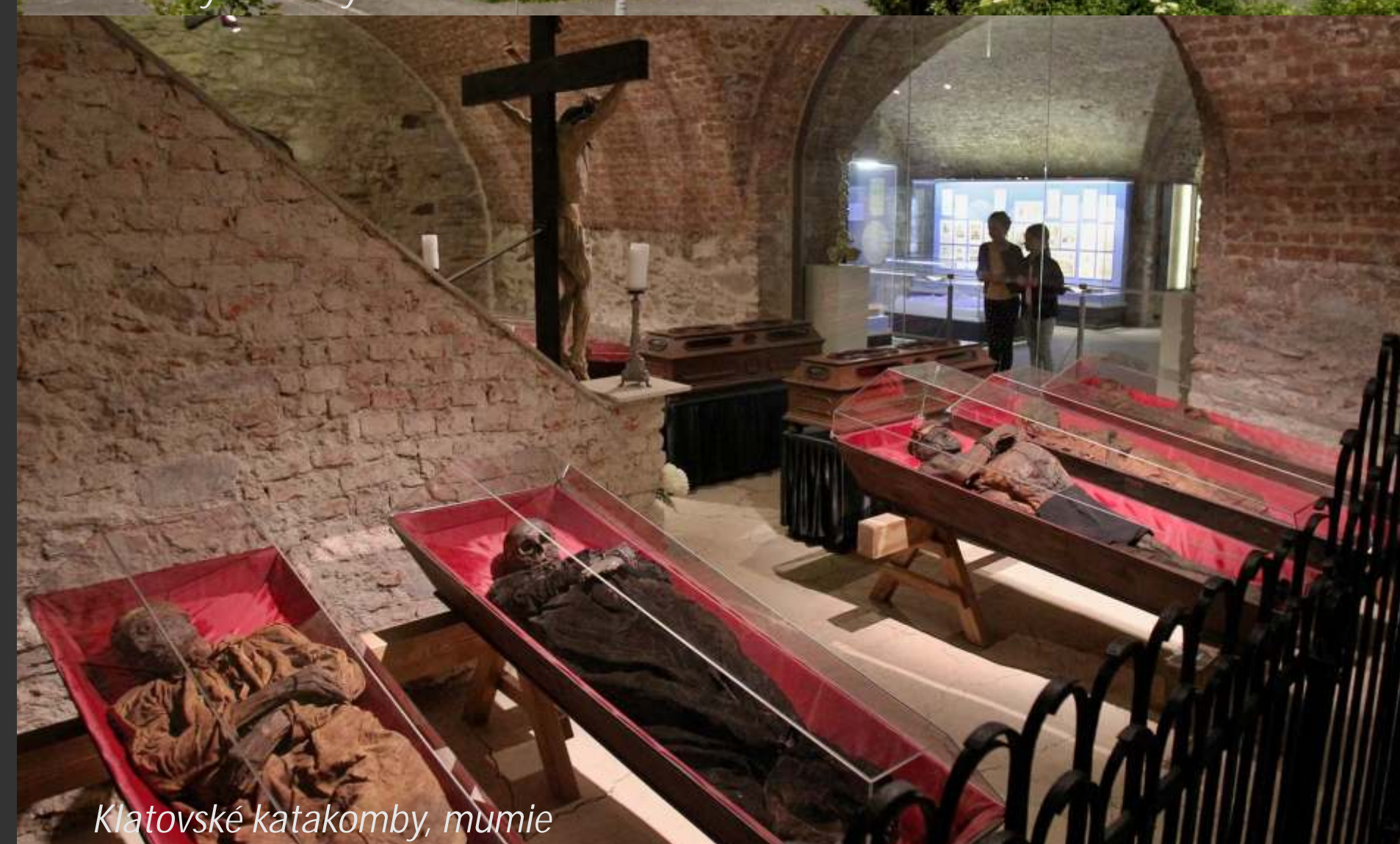
Klatovské katakomby, mumie